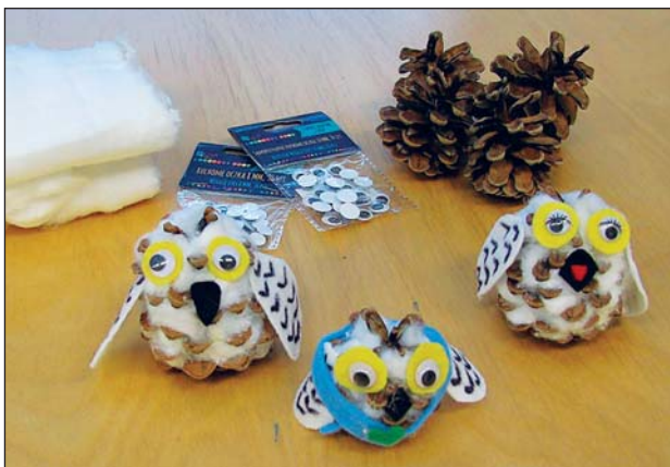
PŘIJĎTE SI vyrobit sněžné sovičky.

Nová vědomostní hra na různá témata z českého jazyka a literatury. Vzpomenete si na všechna vyjmenovaná slova? Víte, kde se píše „i“ a kde „y“? A Babičku od Němcové jste četli? Otestujte své znalosti hned teď, webový odkaz k soutěži naleznete na www.kmo.cz .